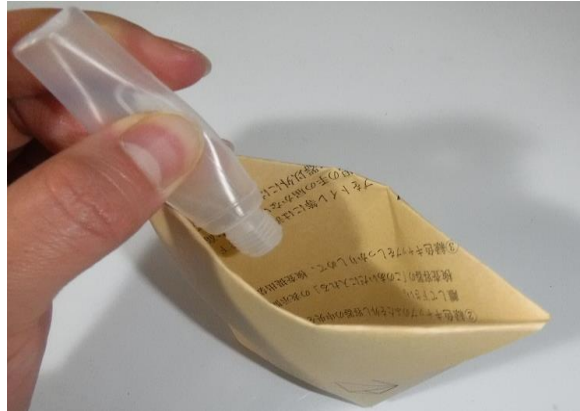
折り畳み式採尿用紙コップ