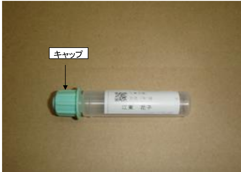
スポイト式尿採取容器